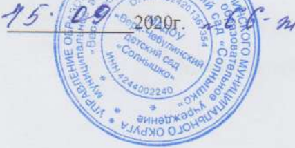
График приема граждан по вопросам противодействия коррупции в учреждении